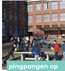
pingpongen op de speelplaats