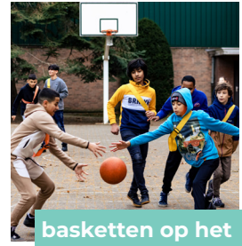
basketten op het pleintje