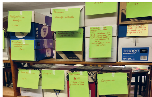
Labels voor de basisregistratie. "Het zag zwart van de groene post-its," zou Switje gezegd hebben.

onze definitieve stek mochten betrekken: de Collectieruimte op de eerste verdieping van de Z-blok. Op de plannen van architect Jos Ritzen stond dit ruime lokaal in 1948 ingetekend als 'studie voor de zusters' , een functie die zij vele jaren vervulde tot er een extra ziekenboeg voor het klooster werd ingericht. Tijdens de coronacrisis fungeerde de opgeknapte ruimte een tijdje als vergaderzaal, maar sinds kort staat ze exclusief ter beschikking van het waardevolle erfgoed van de school, zoals de zusters het verlangden. Vanuit dit nieuwe hoofdkwartier zullen we trachten het werk van zr. Hereswitha (1903-1918), zr. Ludovica (1918-1979) en zr. Ilona zo goed mogelijk verder te zetten.