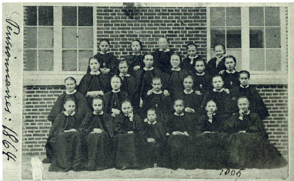
Groepsfoto van het internaat, toen ons Graf een Grafje was (1864-65). Pas in de vroege 20ste eeuw begon het leerlingenaantal exponentieel te groeien als een gevolg van de vernederlandsing.

U zal het misschien niet geloven, maar naar het uniform van het Heilig Graf werd nog maar weinig onderzoek gedaan. Nochtans was het vele jaren alomtegenwoordig. Of is dát nu juist de verklaring? Dat het zó vanzelfsprekend was dat een ronkende reportage nooit nodig leek? En intussen loopt het 22ste schooljaar zónder die ravissante rok alweer op z'n eind.