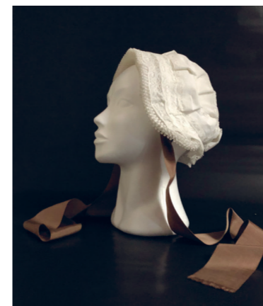
Recent schonken de zusters nog vier gerestaureerde kanten mutsen, een warm gebaar van appreciatie voor het werk van de vrijwilligers.

Met waardering bedoelen we 'een waarde toekennen aan ...' . Wat houden we bij en waarom houden we het bij? Op basis van een visietekst, gestoeld op de geschiedenis van school en klooster, gaan we in dialoog met interne en externe betrokkenen. Beslissingen moeten gedragen worden.