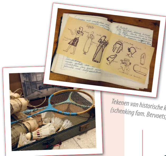
Tekenen van historische kleding (schenking fam. Bervoets).