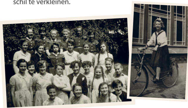
(links) De zomerse weekkleding: het felblauwe matrozenpak voor de internen en de blauwe Vicky-ruitjes voor de externen (1ste Latijnse, 1953).

In tal van Europese regio's verscheen het matrozenpak al in de loop van de 19de eeuw ten tonele. In de hogere maatschappelijke klassen werd het als stijlvolle outfit voor de jongens gebruikt. Na verloop van tijd kwam er een variant voor meisjes. Later deed het zijn intrede als uniform in het onderwijs, omdat het netjes en voornamelijk overkwam, maar evengoed in de hoop het klassenverschil te verkleinen.