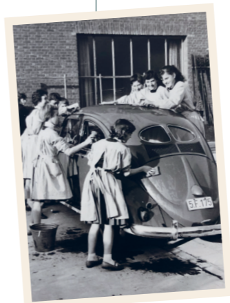
Auto's wassen t.v.v. de missiespaarweek (Klein Graf, 1960). Het nagelnieuwe uniform, beschermd door de schort.