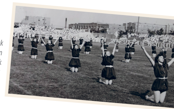
Het barboteuse turnpak bij de viering van 75 jaar katholiek onderwijs in Turnhout (1954).

Tot ver in de jaren '70 droegen de leerlingen een schort boven het uniform. Ook in 1875-80 was er in de week al een zwarte schort of 'tablier noir'. In 1925 werden twee 'zwarte voorschooten met lange mouwen' gevraagd voor in de week en dan nog eens twee witte voor zon- en feestdagen. In 1946-47 werd gesproken van 'twee zwarte voorschooten en drie zomervoorschooten'. Midden jaren '40 zou de beige (of zalmroze) schort zijn intrede hebben gedaan. Rond 1959 kwam daar een blauwgrijze variant bij, specifiek voor de externen. Hoezo? De blauwe was toch voor de internen, horen we u denken. Dat is pas later! Rond 1966 werden de kleuren omgewisseld: nu diende blauw inderdaad voor de internen en beige voor de externen. Het lijkt erop dat de blauwe schort begin jaren '70 eerst verdween en de beige enkele jaren later. De prospectus van 1975-76 leert ons dat er toen alleen nog voor de observatiegraad een schort werd gevraagd.